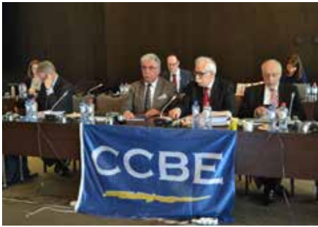
ჯინ-რეიმონდ ლემარი საუბრობს მუდმივმოქმედი კომიტეტის სხდომაზე

18 მარტს CCBE მუდმივმოქმედი კომიტეტის სხდომაზე მიესალმა ორ სტუმარ წარმომდგენს. პირველი, ჯინ-რეიმონდ ლემარი, რომელიც არის ევროპის ექსპერტთა და ექსპერტიზის ინსტიტუტის პრეზიდენტი, რომელმაც წარმოადგინა ახალი ევროპული პროექტი, რომლის მიხედვითაც უნდა შეიქმნას ევროპელ ექსპერტთა კონტაქტების წიგნი, რომელიც ხელს